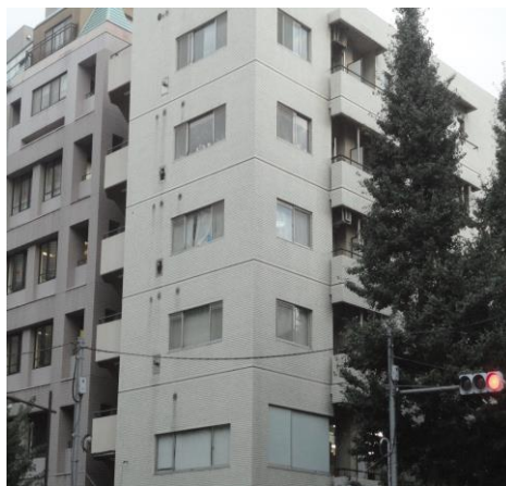
※図面と現況が異なる場合は現況を優先とします。