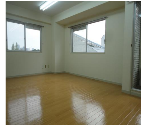
※内見の際は事前にご連絡ください。