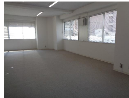
※内見の際は事前にご連絡ください。