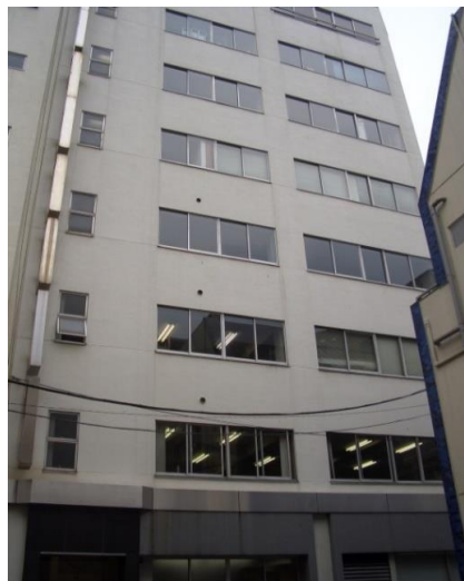
※図面と現況が異なる場合は現況を優先とします。写真は他室