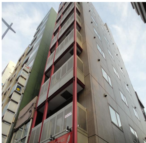
※図面と現況が異なる場合は現況を優先とします。