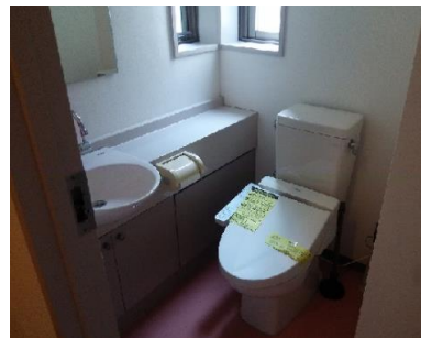
※内見の際は事前にご連絡ください。